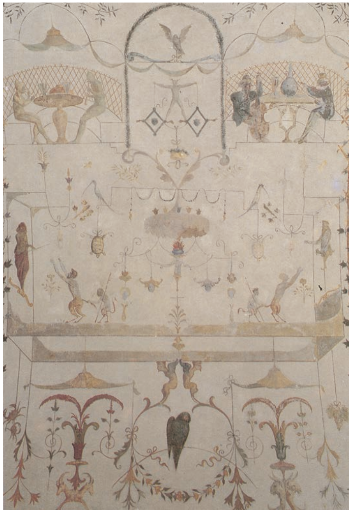
ASSISI - "Volta Pintata" (1556) - Particolare - Raffaellino Del Colle ?