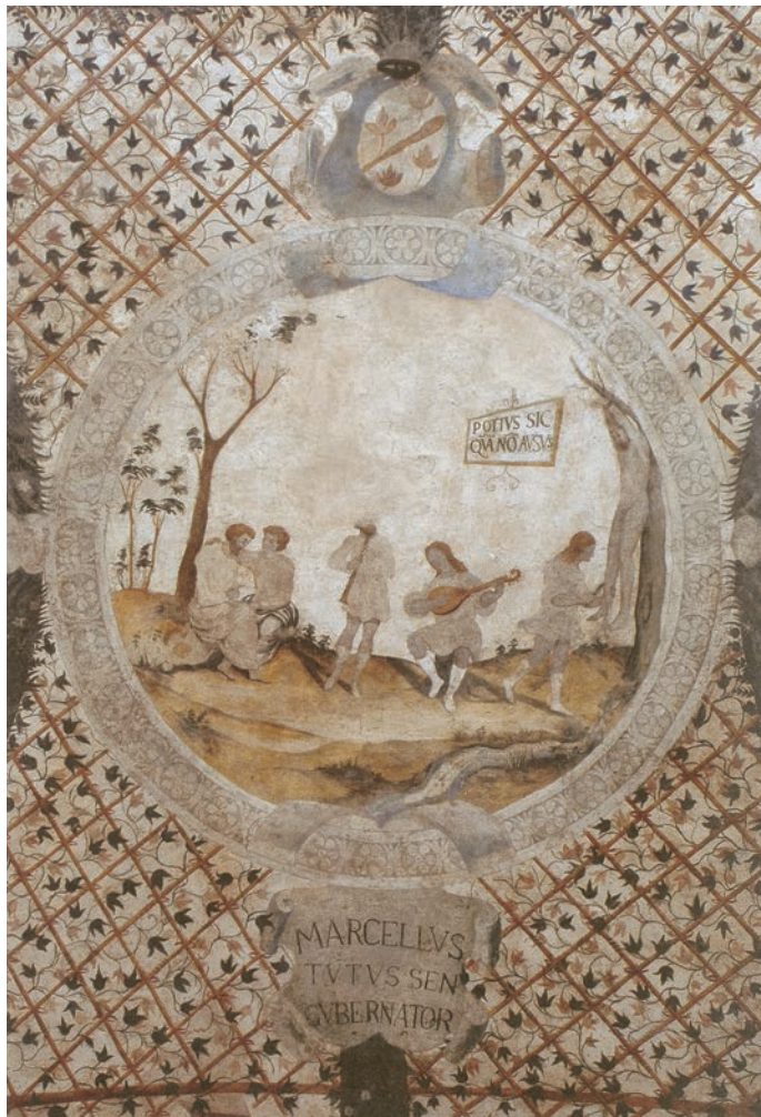
ASSISI - "Volta Pintata" (1556) - Particolare - Raffaellino Del Colle ?