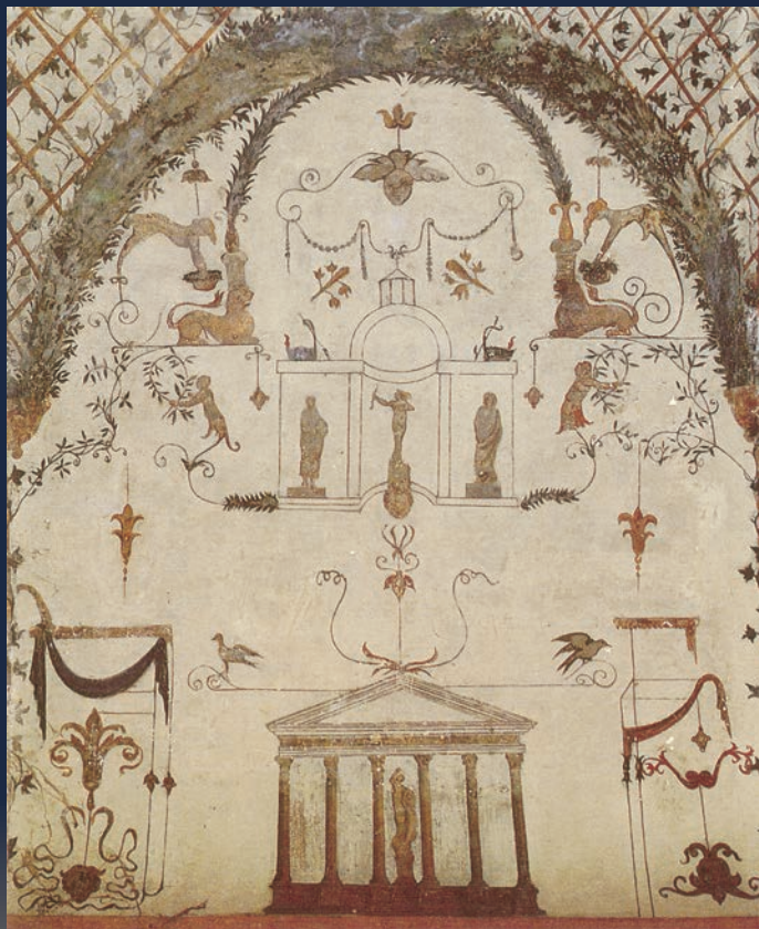
ASSISI - "Volta Pintata" (1556) - Particolare - Raffaellino Del Colle ?