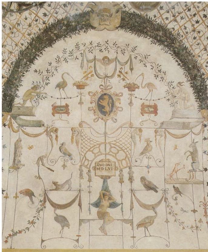
ASSISI - "Volta Pintata" (1556) - Particolare - Raffaellino Del Colle ?