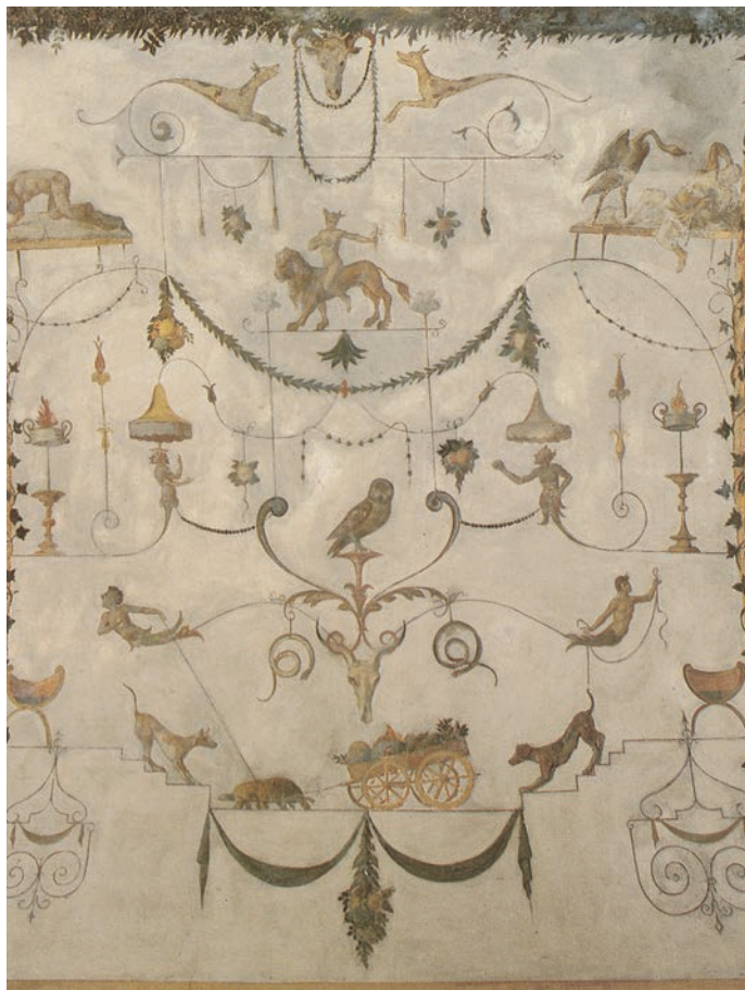
ASSISI - "Volta Pintata" (1556) - Particolare - Raffaellino Del Colle ?