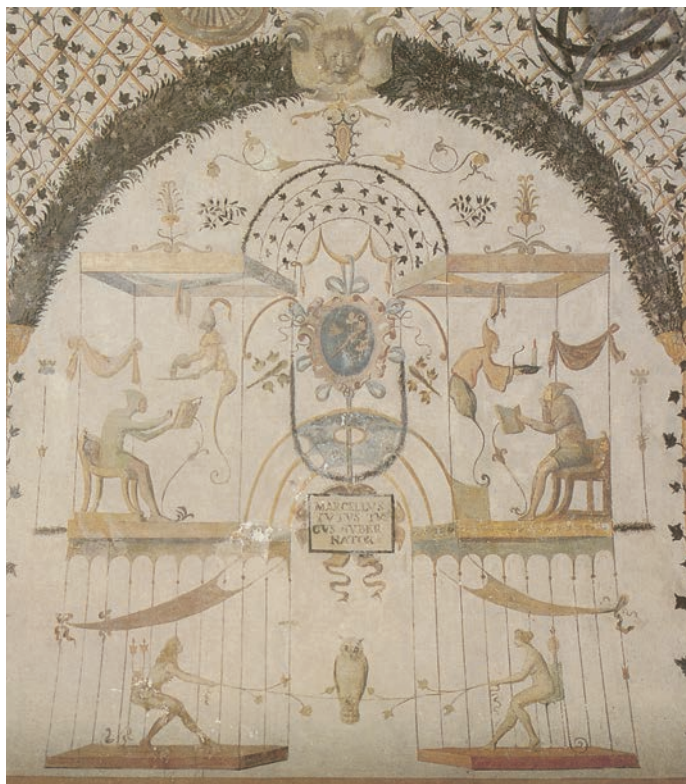
ASSISI - "Volta Pintata" (1556) - Particolare - Raffaellino Del Colle ?